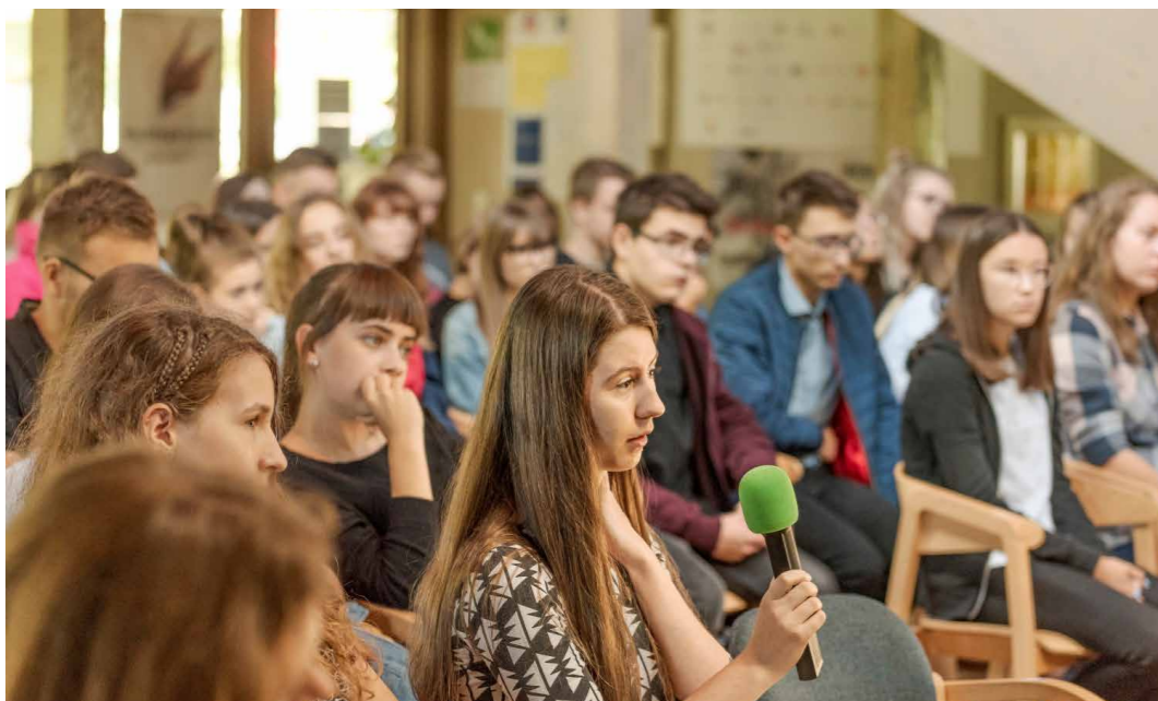
Uczniowie podczas otwarcia wystawy #StolenMemory w Międzynarodowym Domu Spotkań Młodzieży w Oświęcimiu (MDSM) we wrześniu 2019 roku.

Także Państwo wraz z polsko-niemiecką grupą młodzieży mogą wziąć udział w tej ważnej kampanii i zwrócić potomkom ofiar »skradzioną pamięć« o ich bliskich.