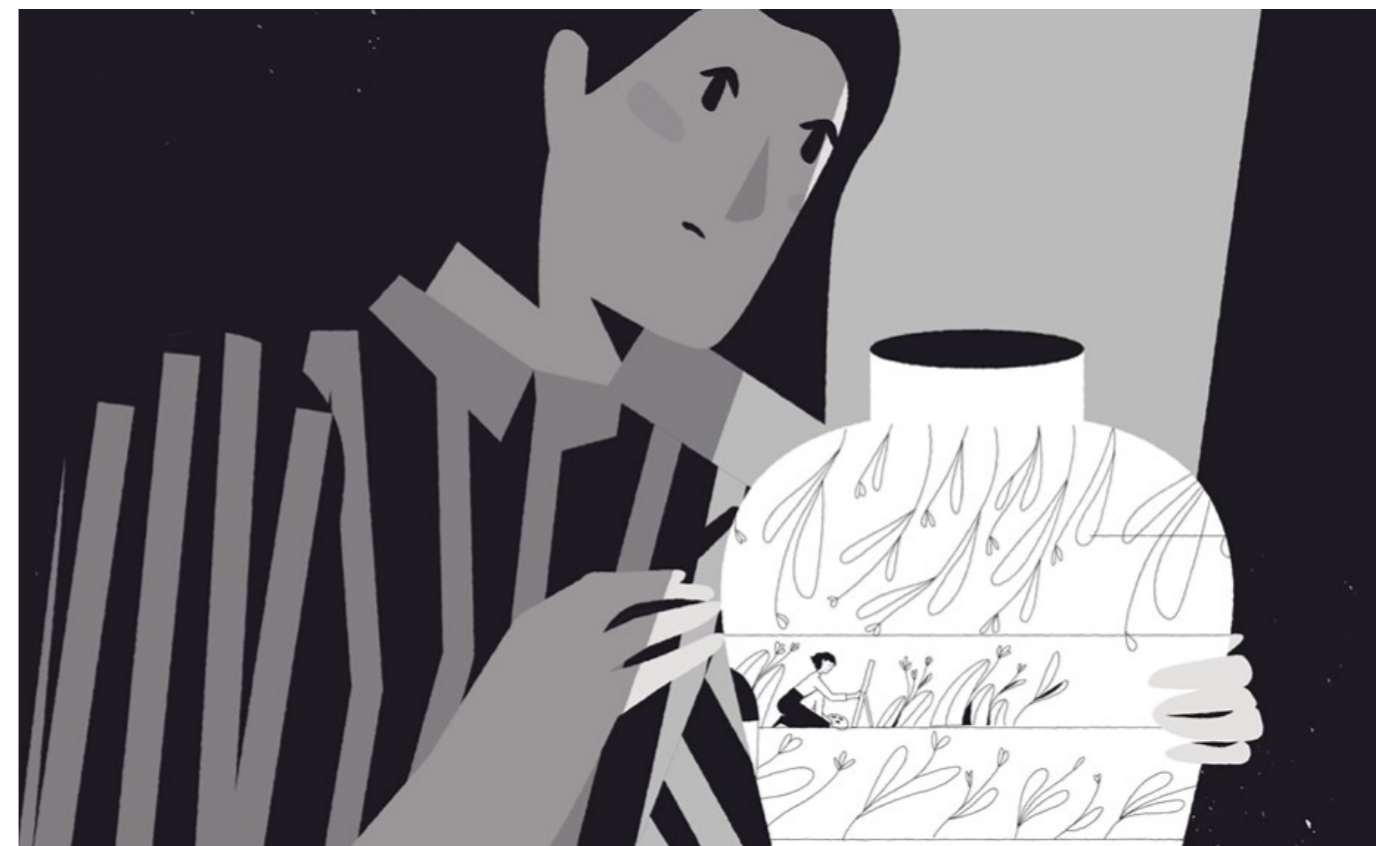
Jeden z filmów animowanych opowiada historię aresztowanej przez nazistów uczennicy, Heleny Posterskiej.

Moduły dydaktyczne mogą być wykorzystywane pojedynczo, w zestawie pozwalającym wypełnić cały dzień projektowy lub niezależnie od wizyty na wystawie.