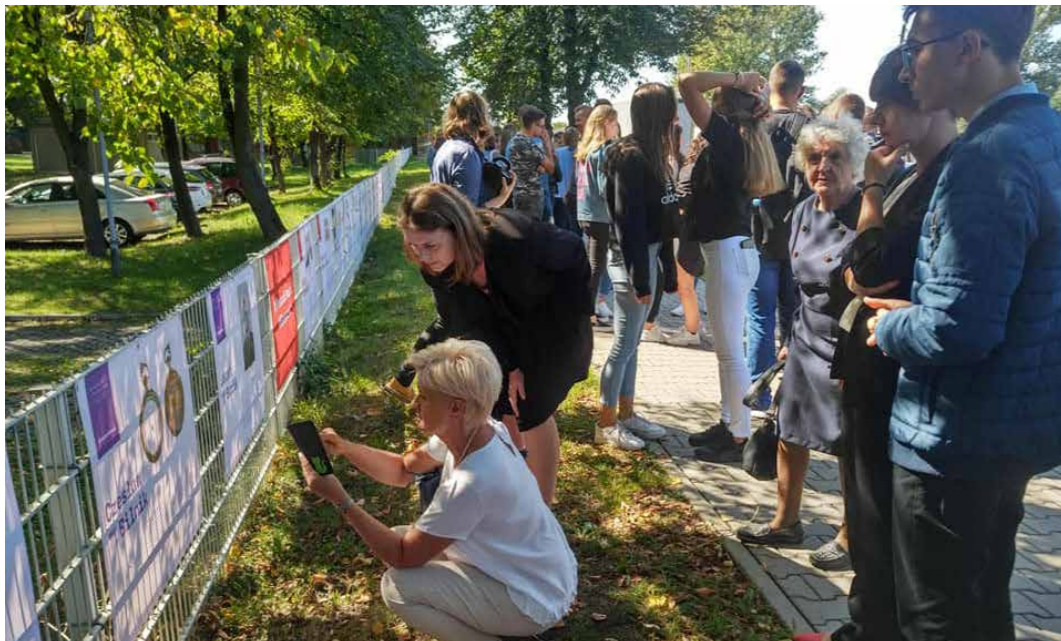
W ramach współpracy z Międzynarodowym Domem Spotkań Młodzieży w Oświęcimiu kampania #StolenMemory przekształcała się w projekt edukacyjny. Uczniowie z nauczycielami przed wystawą #StolenMemory w Oświęcimiu.

Więcej informacji na temat kampanii: www.pnwm.org/stolenmemory