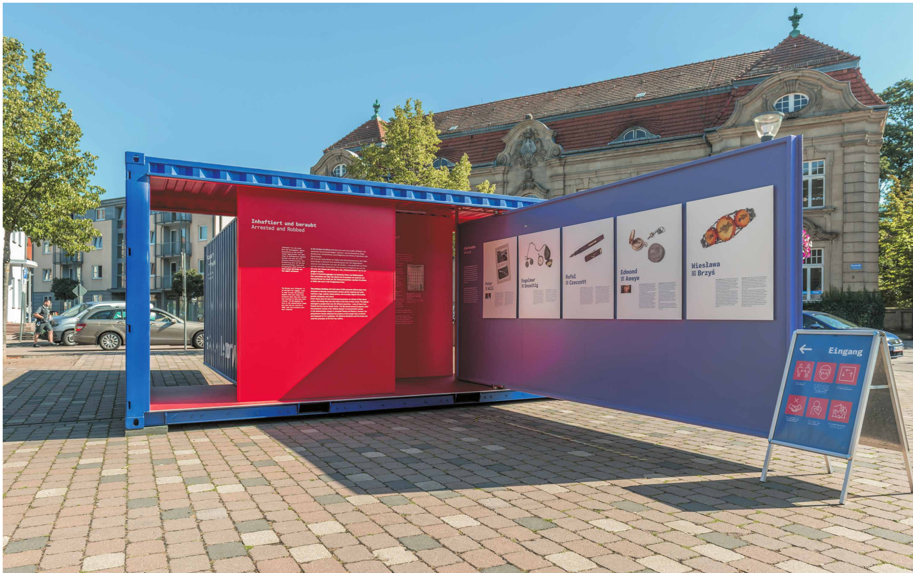
Zrealizowana w morskich kontenerach wystawa objazdowa #StolenMemory odwiedza miasta w Niemczech, Polsce, Belgii i Francji.